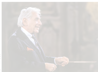
Leonard Bernstein (1918–1990): Dirigent, Komponist, Pianist